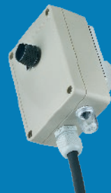
230 V Netzadapter