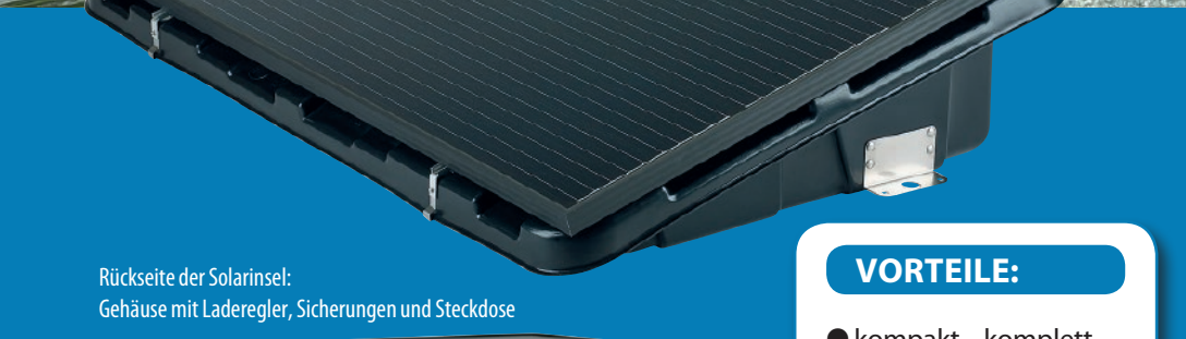
Rückseite der Solarinsel: Gehäuse mit Laderegler, Sicherungen und Steckdose

... ermöglicht Wasserbelüftung ohne Netzstrom!