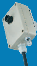
Stecker mit Drehzahlregelung und Motorschutz