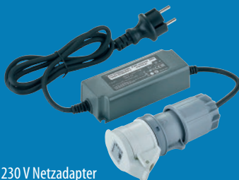
230 V Netzadapter